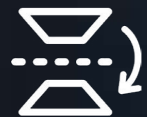
Tecnología Flip Chip