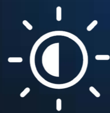
Brillo de hasta 6.000 nits