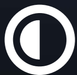
Alto ratio contraste 10.000 : 1